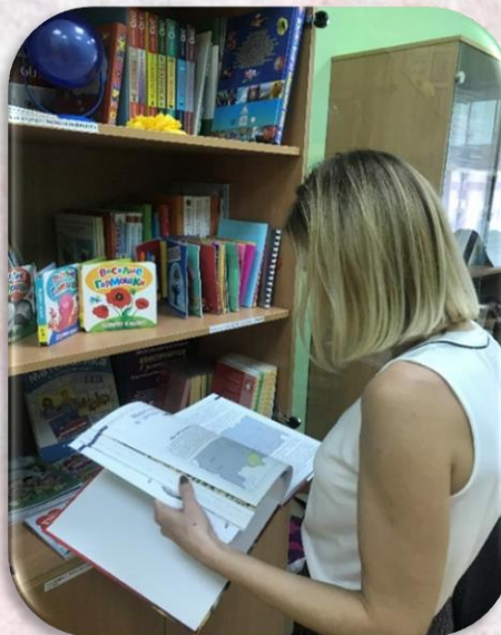
Подбор литературы и наглядно-демонстративного материала