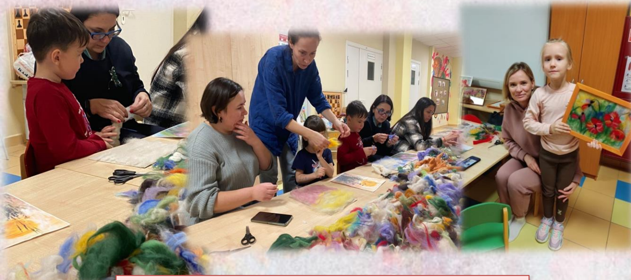
Мастер-класс «Родитель + ребенок»

Шерстяная (теплая) акварель — современный вид декоративно-прикладного искусства: «рисование» с помощью шерстяных волокон различных цветов и оттенков. За счёт того, что шерсть выкладывается слоями, образуется одновременно и объёмность, фактурность «рисунка», и цветовой эффект, схожий с художественными работами в технике акварели с характерными разводами. Сегодняшний ассортимент натуральной шерсти, имеющийся в продаже — это обширная цветовая гамма. Такое цветовое разнообразие позволяет создавать по-настоящему живописные работы — пейзажи, натюрморты, абстракции, даже портреты.