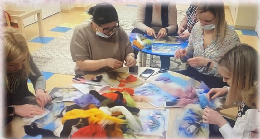
Мастер-класс с педагогическим составом

Шерстяная (теплая) акварель — современный вид декоративно-прикладного искусства: «рисование» с помощью шерстяных волокон различных цветов и оттенков. За счёт того, что шерсть выкладывается слоями, образуется одновременно и объёмность, фактурность «рисунка», и цветовой эффект, схожий с художественными работами в технике акварели с характерными разводами. Сегодняшний ассортимент натуральной шерсти, имеющийся в продаже — это обширная цветовая гамма. Такое цветовое разнообразие позволяет создавать по-настоящему живописные работы — пейзажи, натюрморты, абстракции, даже портреты.