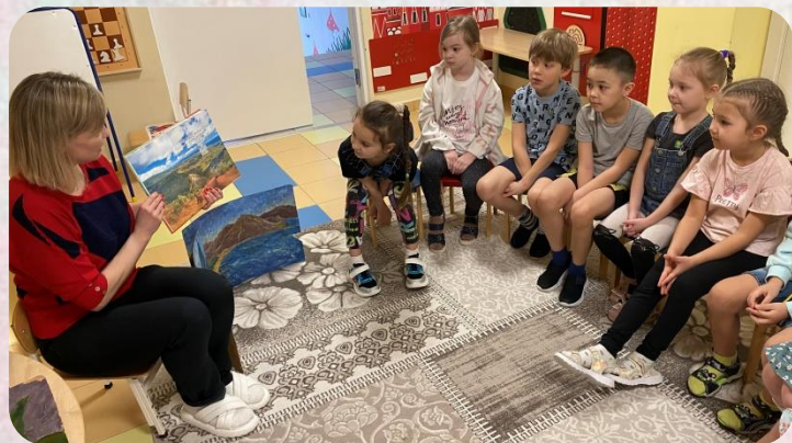
Погружение в тему проекта

Цель: Разработка проектного замысла. Определить возможности сбора и пополнения информации.