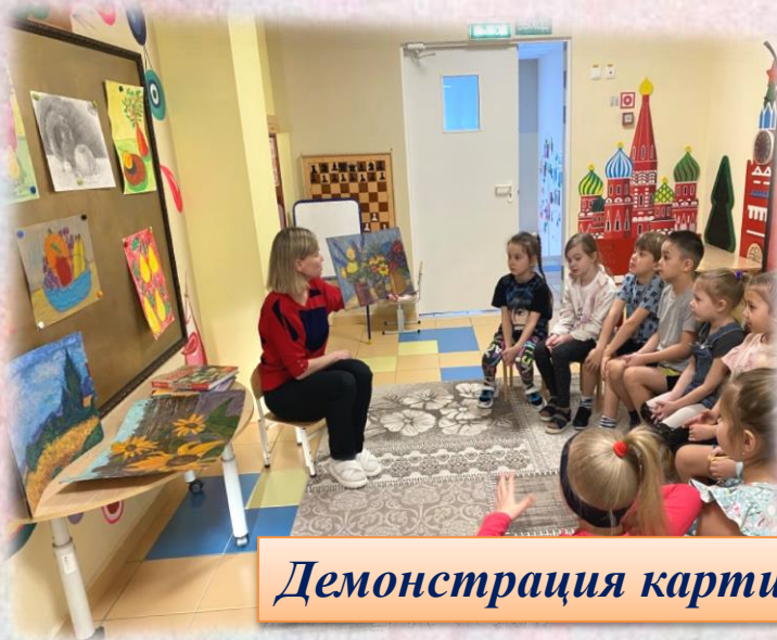
Демонстрация картин. Натюрморт

Натюрморт – это жанр изобразительного искусства, показывающий различные предметы, такие как предметы обихода, фрукты, цветы или еда, организованные в единую группу картины. Термин натюрморт пришел от французского слова, буквально означающего «мертвая природа»