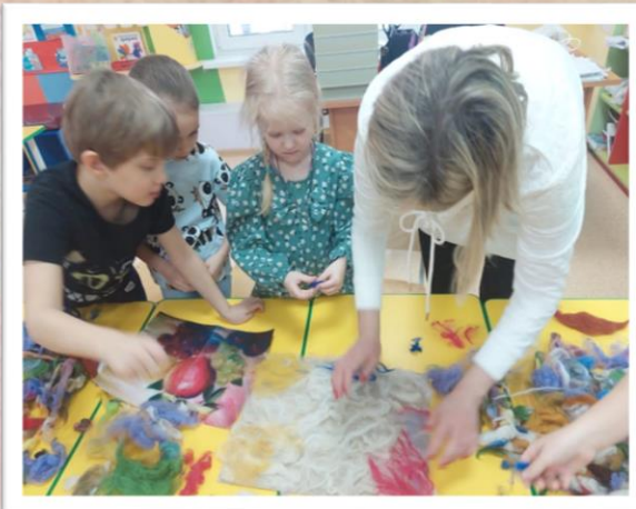
Накладываем фоновый тон