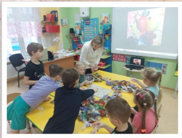
Выкладываем основу из белой шерсти