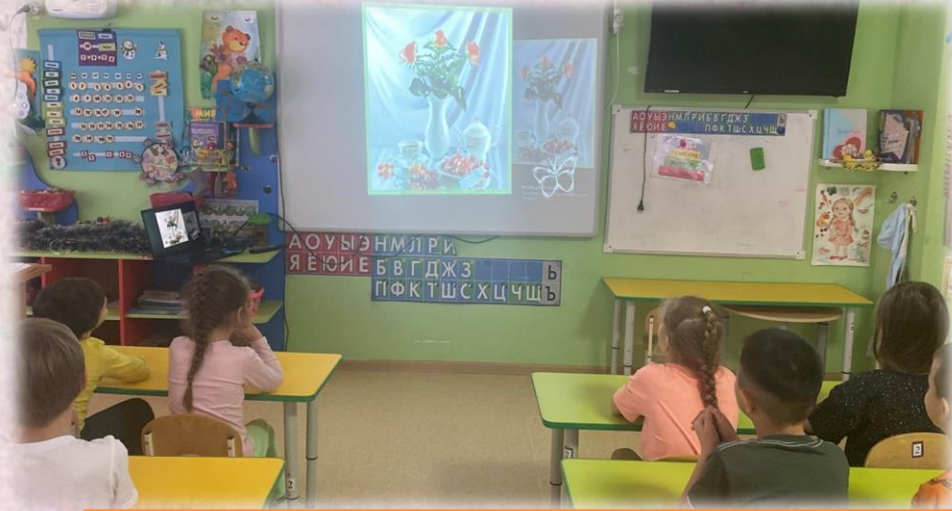
Просмотр презентаций. Натюрморт