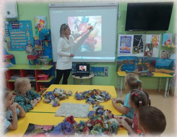
Обсуждение хода работы