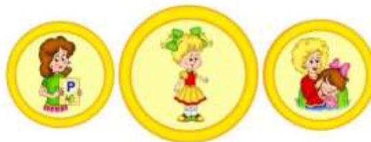
Схема взаимодействия учителя-логопеда и педагога-психолога