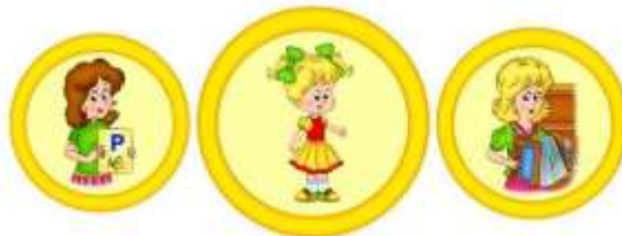
Схема взаимодействия учителя-логопеда и музыкального руководителя