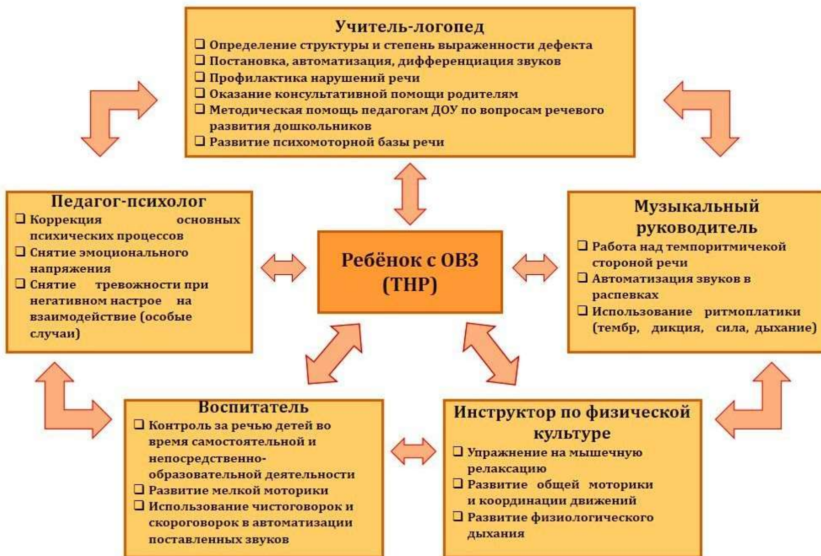
Схема взаимодействия участников коррекционного процесса МАДОУ детского сада № 119