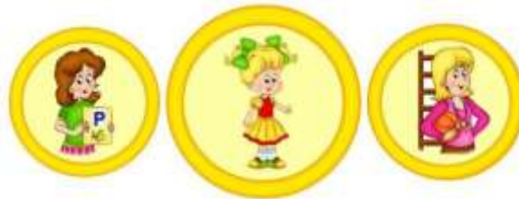
Схема взаимодействия учителя-логопеда и инструктора по физической культуре